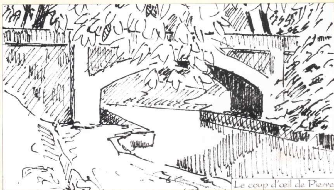
Le coup d'œil de Pierre

Je vous conseille donc d'aborder votre peinture sans vous appesantir sur une seule partie. Travaillez d'un point à un autre, étape par étape, sans laisser pour plus tard tel ou tel vide. Le résultat en sera plus harmonieux.